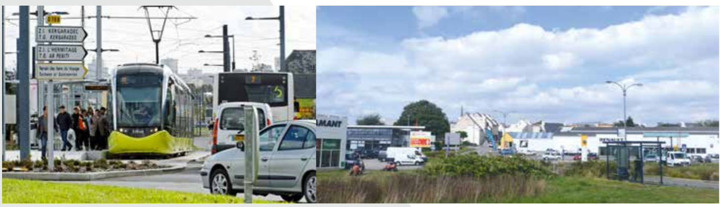
Proximité des axes structurants, du tramway + liaison navette Bibus

Conservation du chemin creux patrimonial existant et création de nouveaux cheminements piétons.