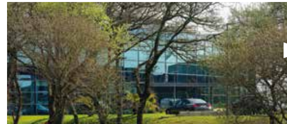
Batiment de bureaux