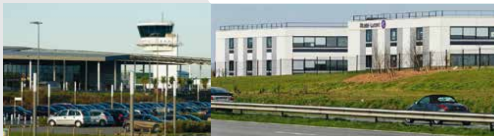
L'aéroport international Brest Bretagne

• Prat Pip a reçu le label Qualiparc : une valorisation supplémentaire, signe du soin que nous accordons à l'accueil des entreprises.